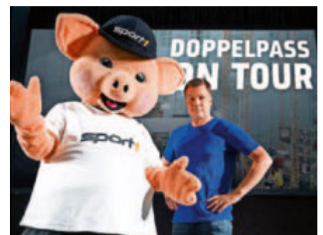
Die interaktive Bühnenshow „Doppelpass on Tour“ macht Station in Radolfzell.

Informationen gibt es unter: milchwerk-radolfzell.de/event/doppelpass-on-tour