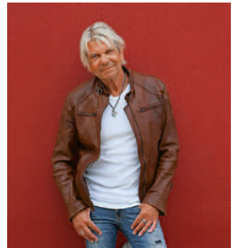
Matthias Reim kommt ins Milchwerk.

Zum Abschluss des diesjährigen Milchwerk Musik Festivals gibt sich eine weitere Ikone die Ehre: Am Freitag, 06.12.2024 kommt der ehemalige Radolfzeller Matthias Reim zurück in seine alte Heimat. Denkt man an die Legenden deutscher Musik, führt an dem Schlager-Rocker absolut kein Weg vorbei. Reims unverkennbar rockiger Stil prägt seit 30 Jahren die Musikszene und machte ihn zu einem der beliebtesten deutschen Künstler. Mit seinem besonderen Talent für fesselnde Melodien schrieb er große Hits, darunter echte Evergreens, die viele mitsingen können. Tickets gibt es bei der Tourist-Info in Radolfzell in der Seestraße 30, Telefon 0 77 32 / 81-500, oder unter www.reservix.de .