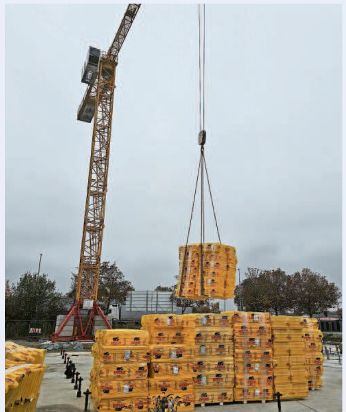
Zum zweiten Baustart wurde Dämm-Material für die Bodenplatte auf der Baustelle angeliefert.