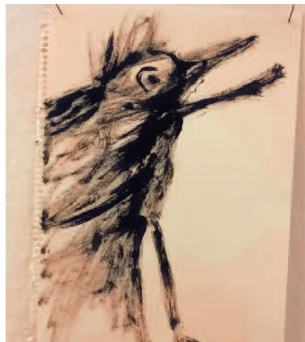
Ein Exponat der letzten Mitgliederausstellung.