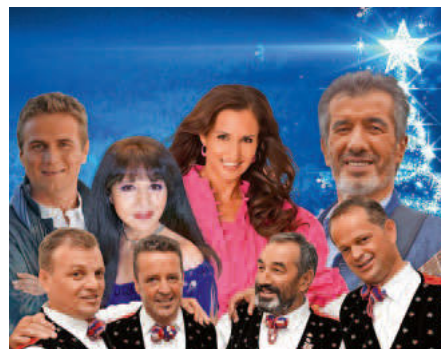
Bei „Zauberhafte Weihnachtssterne“ werden einige der bekanntesten Künstler der Schlager- und Volksmusikszene für festliche und besinnliche Atmosphäre sorgen.

Die Zauberhaften Weihnachtssterne bieten eine ideale Möglichkeit, der Hektik der Vorweihnachtszeit zu entfliehen und sich von stimmungsvoller Musik in eine festliche Welt entführen zu lassen. Diese Konzertreihe steht für Besinnlichkeit, Tradition und fröhliche Momente.