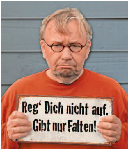
Sein neues Programm „Reg' dich nicht auf. Gibt nur Falten!“ präsentiert Bernd Stelter am Sonntag, 08.12.2024 im Milchwerk.

Sein neues Programm „Reg' dich nicht auf. Gibt nur Falten!“ präsentiert Bernd Stelter am Sonntag, 08.12.2024 um 19.00 Uhr im Milchwerk. Und verspricht: Es gibt eine Menge zu lachen! In zwei Stunden werden Falten geglättet, das Hautbild verbessert und die Mundwinkel nach oben gezogen. Es ist quasi eine Zwei-Stunden-Beautybehandlung ganz ohne Botox und lästige Schönheitschirurgen. Denn worüber regen wir uns nicht alles auf? Über das Knöllchen an der Windschutzscheibe, die langsame Kassiererin an der Supermarktkasse, über die Bundesregierung und über das Wetter. Wenn wir uns ärgern, wenn wir zornig sind, dann gräbt sich die Glabellafalte zwischen den Augenbrauen tief in unsere Haut. Deswegen heißt sie ja auch so: Zornesfalte. Und das sieht dann jeder. Wenn wir lachen, verbessert sich unser Hautbild. Mit einem Lächeln im Gesicht werden wir für unsere Mitmenschen attraktiver. Das andere Geschlecht fühlt sich zu uns hingezogen. Und Lachen ist gesund. Die Lunge wird trainiert, das Gehirn kriegt eine Sauerstoffdusche. Tickets gibt es bei der Tourist-Information in Radolfzell, Seestraße 30, Telefon 0 77 32 / 81-500, sowie im Internet unter www.reservix.de . Weitere Informationen: www.lse-bodensee.de/