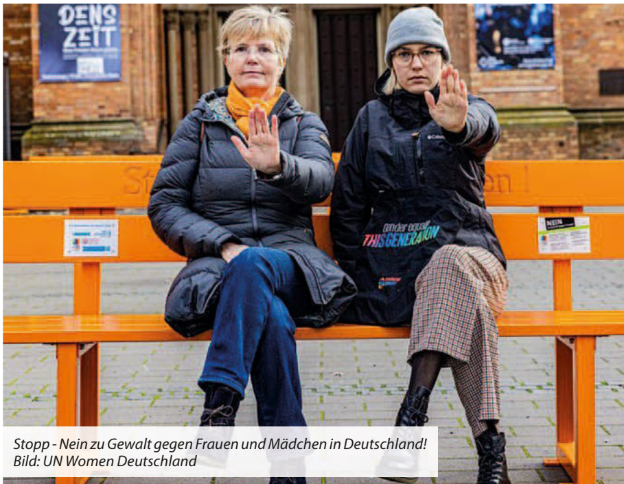
Stopp - Nein zu Gewalt gegen Frauen und Mädchen in Deutschland!