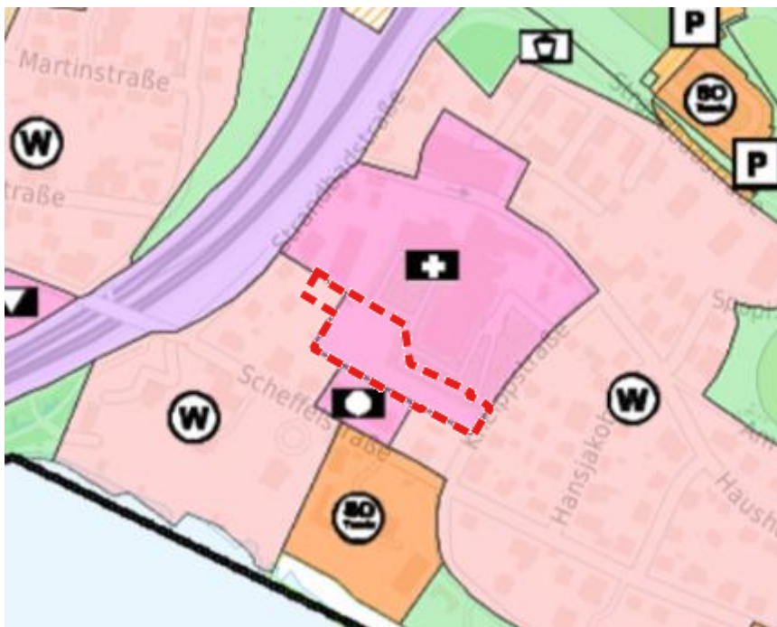
Abb. 2: Geltungsbereich (rote Umrandung) im Flächennutzungsplan (Ministerium für Landesentwicklung und Wohnen, o. J.)

Der Flächennutzungsplan weist die Fläche des geplanten Geltungsbereiches bereits als „Gemeinbedarfsfläche Bestand“ mit der Art „gesundheitlichen Zwecken dienende Gebäude und Einrichtungen“ sowie