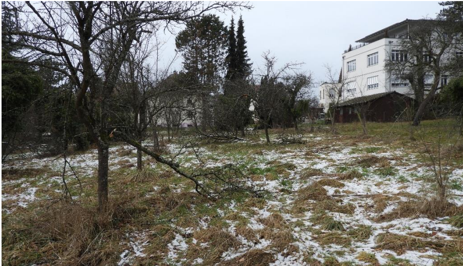
Abb. 4: Blick über den westlichen Teil des Geltungsbereichs

Kultur und Sachgüter sind innerhalb des Geltungsbereichs nicht bekannt.