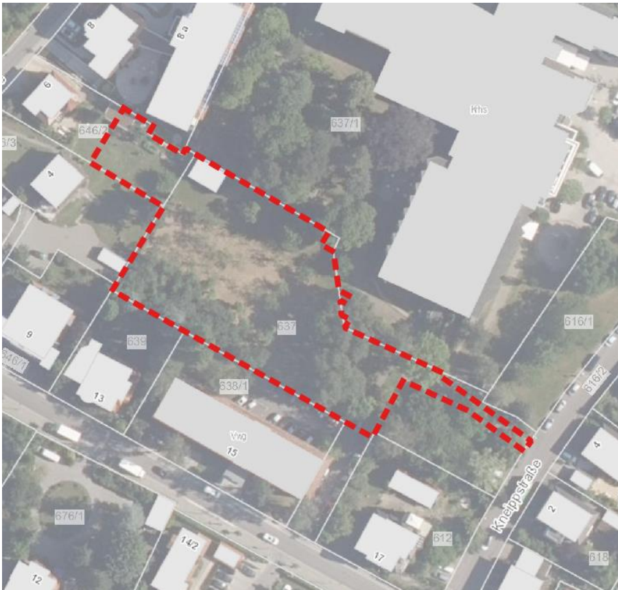
Abb. 1: Räumliche Lage des Bebauungsplans (rote Umrandung)

Der Bebauungsplan soll im beschleunigten Verfahren nach § 13a BauGB aufgestellt werden. Im beschleunigten Verfahren wird von der Umweltprüfung und dem förmlichen Umweltbericht sowie der Eingriffsregelung abgesehen. Davon unberührt bleibt die Verpflichtung, die Umweltbelange nach § 1 Abs. 6 Nr. 7 und § 1a Abs. 2 BauGB bei der Aufstellung von Bauleitplänen zu berücksichtigen. Ebenso sind die artenschutzrechtlichen Bestimmungen der §§ 44 und 45 BNatSchG sowie die Bestimmungen zu Umweltschäden nach § 19 BNatSchG weiterhin zu beachten.